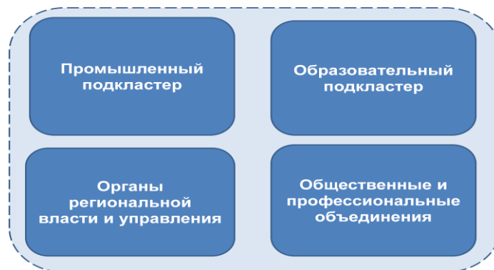
рис 1. Состав субъектов транспортно-логистического кластера Пермского края

Руководящие функции транспортно-логистического кластера предлагается возложить на координационный совет, состоящий из представителей всех субъектов кластерного объединения.