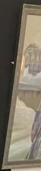
Portrait of a soldier in a helmet, likely a member of the Finnish Air Force during the Winter War.