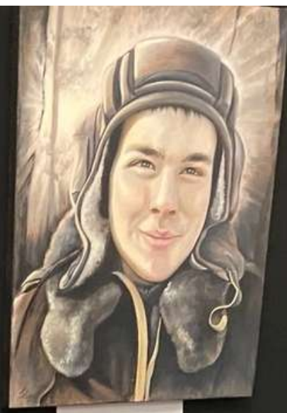
Portrait of a female pilot, likely a member of the Finnish Air Force during the Winter War.